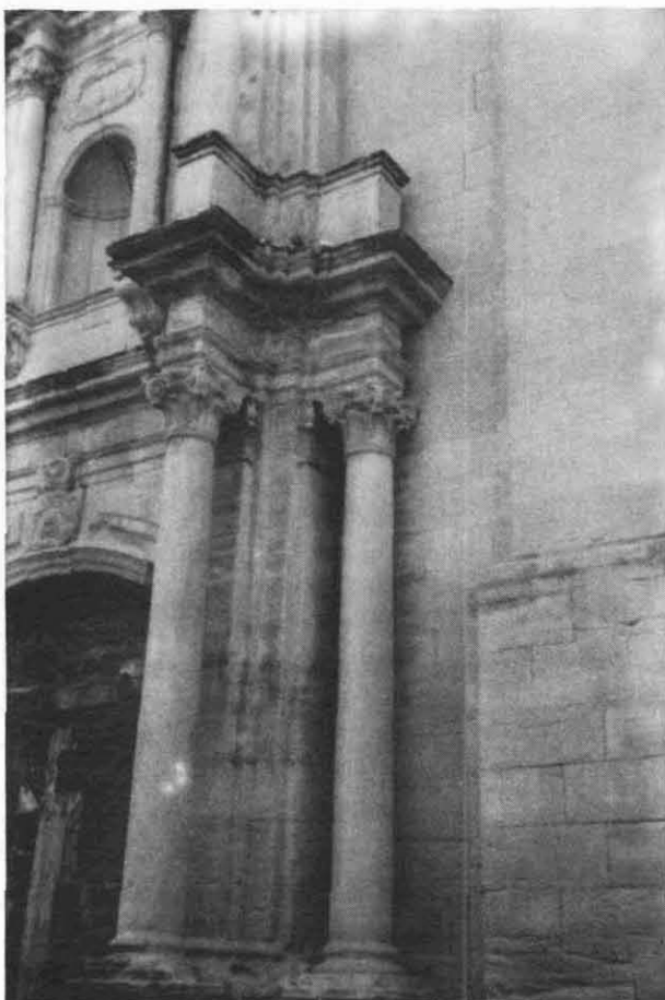
Columnes i retropilastres del primer cos de la portada

«... Y halló estar con la debida decensia, pero informado S.S.I. de que esta Iglta. Parroq. es muy reducida para los vecinos que hay en esta villa, pues no pueden caber todos en Iglta. de forma que en las principales festividades y especial en los de Quaresma, y de concurso a los Sermones mucha parte de otros vecinos era preciso se quedasen en la parte fuera de la Iglta. expuestos a la incomodidad del tiempo, a más de no poder oír de cerca la palabra Divina. Para evitar estos inconvenientes tan notorios: Exhortava y encargaba S.I. a los Regidores y demás vecinos de esta villa vean el modo de hacer Iglta. que tenga la capacidad correspondiente valién-