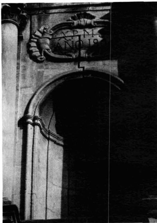
Detall de la portalada

En la clau de volta de l'àbsis central apareixen pintades les claus de Sant Pere i la tiara papal, element repetit en la portalada.