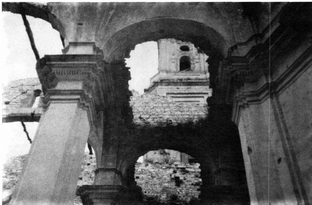
Columna i pilastra de la nau lateral

Abans no arribés la nova dinastia Borbònica, circulaven per Espanya unes idees artísti-