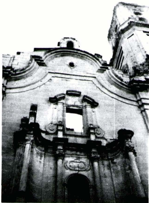
Detall de cos superior de la portada

Les últimes dades que hem pogut trobar indiquen que l'any 1792, i a l'edat de 76 anys, sol·licità un ajut amb motiu de la seva mala salut i li foren concedits 4 reals diaris sobre el pa i una porció del jornal que percebia. Aquesta qüestió es recolleix en una carta escrita per Francesc Melet on demana socors al Capítol, i la concessió aprovada en la junta d'aquest organisme. Els esmentats documents són força interessants de